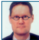
R.O. (Robert) Heida Pensioendesk / Vestiging Waalwijk

De einduitspraak van het Hof betekent echter nog niet dat de discussie definitief voorbij is. De Staatssecretaris heeft inmiddels beroep in cassatie bij de Hoge Raad ingesteld. Daarnaast lopen er nog verschillende procedures met betrekking tot de vraag of het opleggen van een conserverende aanslag in overeenstemming is met het van toepassing zijnde belastingverdrag. De uitkomst van de onderhavige procedure zal hiervoor zeker van belang zijn. Wij houden u op de hoogte!